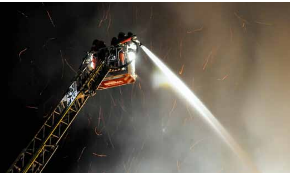
Von der ADL aus werden die Löscharbeiten unterstützt.

der Wärmebildkamera aufgeboten. Unter Atemschutz wird das aus 16 Kammern bestehende Silo abgedeckt und von oben begutachtet. Dabei stellt man fest, dass es in einer Zelle aufgrund der Resttemperatur zu einer Selbstentzündung gekommen ist. Wieder wird gelöscht, allerdings mit möglichst wenig Wasser, um ein Aufquellen des Siloinhalts zu vermeiden.